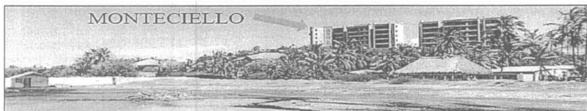
Imagen N° 2. Conjunto residencial Monteciello.

En el sector de las playas de Sabanilla Country, corregimiento de Sabanilla del Municipio de Puerto Colombia- Atlántico, se encuentra en operación la construcción del Conjunto Residencial Monteciello, donde se llevan a cabo actividades de remoción de tierras, como se muestra en la imagen N°2.